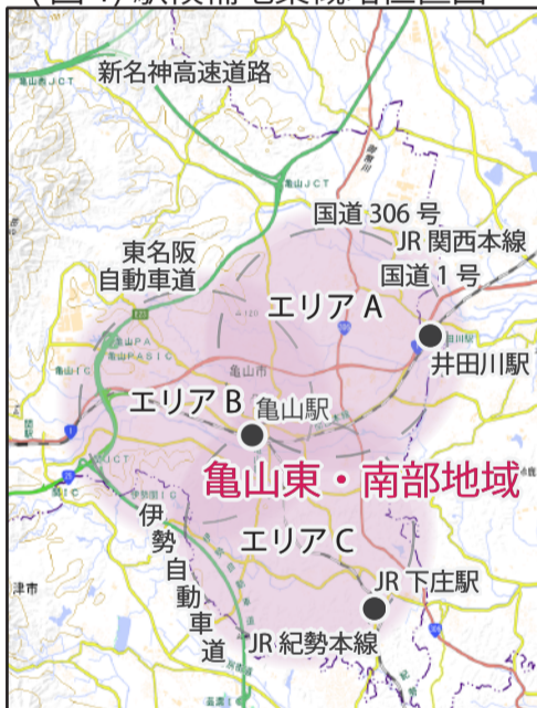
(図1) 駅候補地案概略位置図